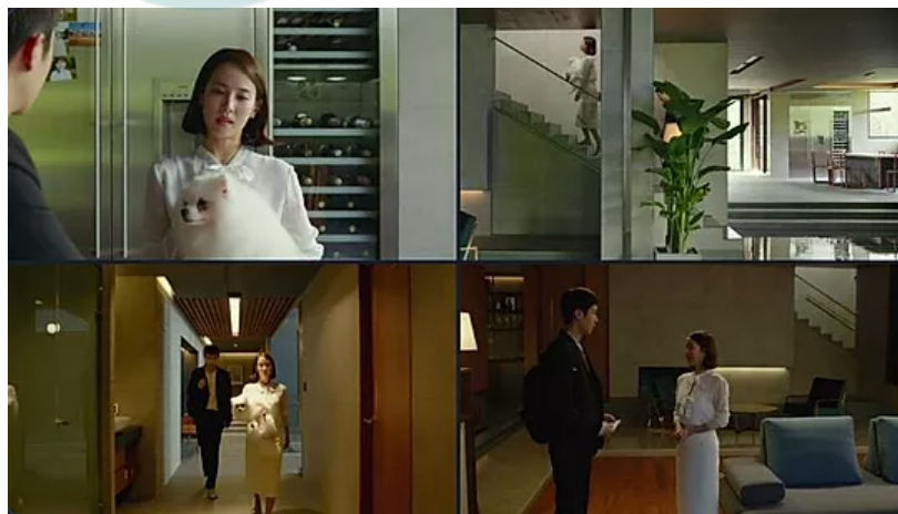
Líneas divisorias entre los personajes Fotograma de Parásitos (2019)

Sin embargo, no es del todo fácil posicionarse con la familia pobre. En un determinado momento, en el que los Park, la familia rica, abandona el hogar para disfrutar de una excursión, el ama de llaves timbra pidiendo acceder a la casa con mucha urgencia alegando que había olvidado algo, esto desconcierta a los Kim. Es aquí cuando descubren que la ama de llaves escondía a su marido de los usureros en un búnker secreto. Ante esto, se produce un conflicto en el que, en un primer momento, la madre de los Kim se debate entre atender las plegarias de la mujer y dejar vivir ahí al marido o hacer saber a los Park de la situación. Pero es cuando el ama de llaves descubre que la madre de los Kim había invitado a toda la familia a pasar la noche cuando tiene lugar un giro en la negociación, en la que ahora es la familia la que suplica. Esto pone de relieve que para mantener lo que